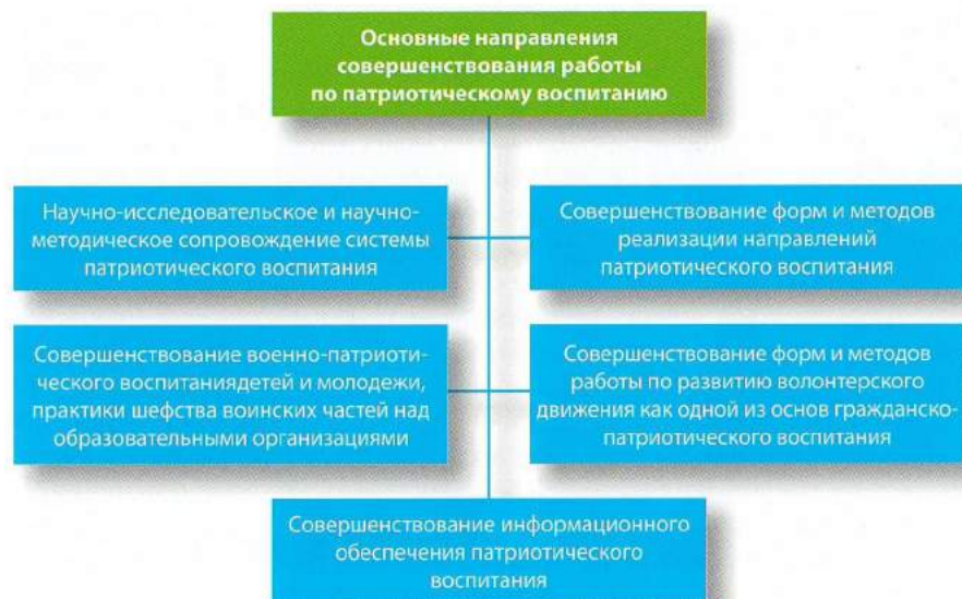
Рисунок 3. Основные направления совершенствования работы по патриотическому воспитанию в соответствии с Государственной программой «Патриотическое воспитание граждан Российской Федерации на 2016-2020 годы».

Целью государственной политики в сфере патриотического воспитания является создание условий для повышения гражданской ответственности за судьбу страны, повышения уровня консолидации общества для решения задач обеспечения национальной безопасности и устойчивого развития Российской Федерации, укрепления чувства сопричастности граждан к великой истории и культуре России, обеспечения преемственности поколений россиян, воспитания гражданина, любящего свою Родину и семью, имеющего активную жизненную позицию.