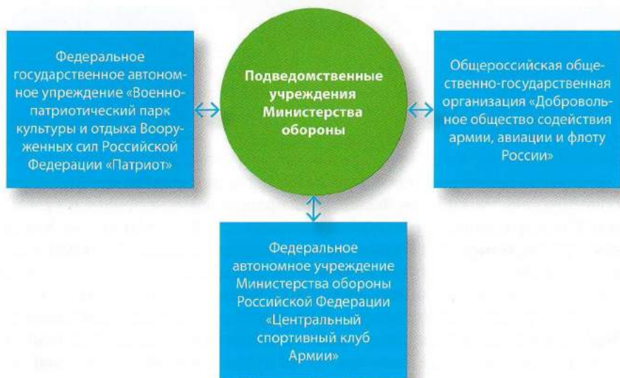
Рисунок 7. Подведомственные учреждения Министерства обороны Российской Федерации.

При взаимодействии с Федеральной службой безопасности Российской Федерации необходимо действовать в соответствии с ведомственными инструкциями. Как правило, в территориальных органах ФСБ России есть сотрудник, курирующий детско-юношеские патриотические организации, либо с вами будет работать сотрудник кадровой службы.