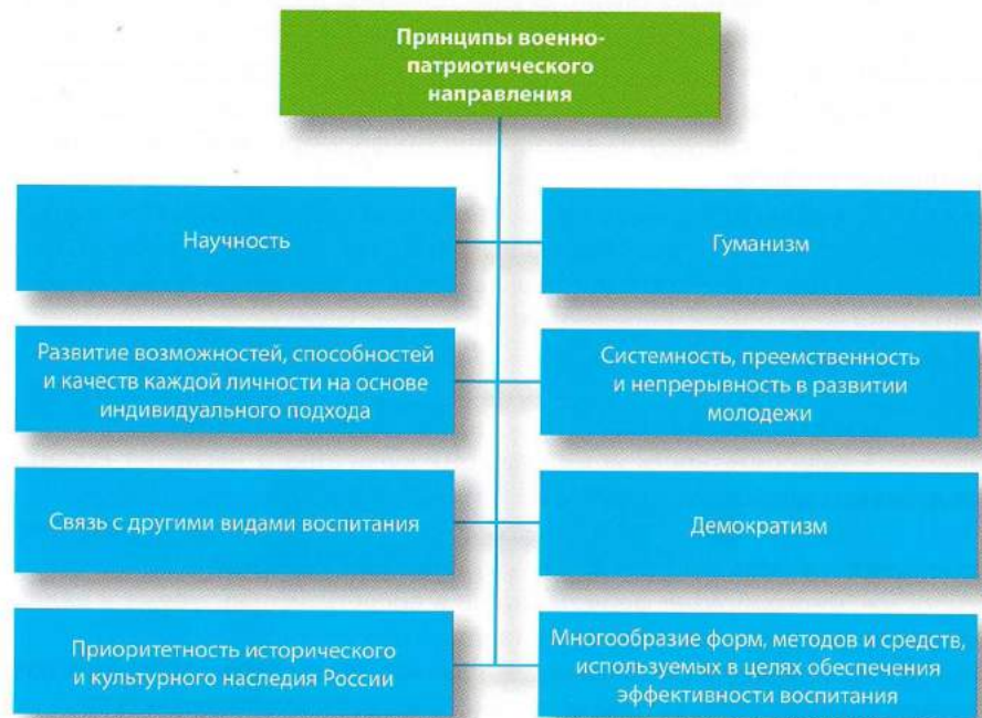
Рисунок 2. Принципы военно-патриотического направления Российского движения школьников.