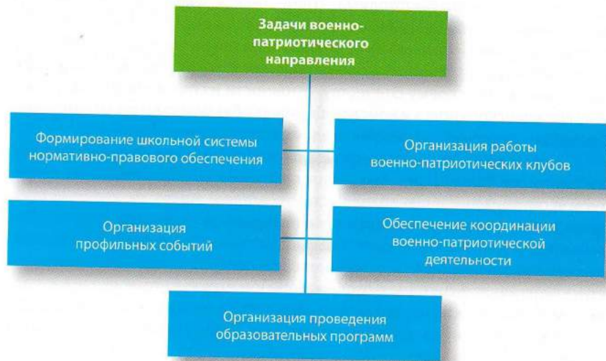
Рисунок 1. Задачи военно-патриотического направления Российского движения школьников.