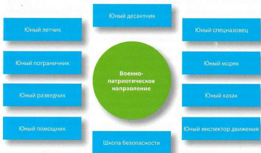
Рисунок 5. Основные направления деятельности военно-патриотических клубов.

назначения, базирующихся неподалёку от школы невозможно. И конечно основную роль при координации работы со всеми перечисленными ведомствами и организациями отводится региональным и муниципальным органам власти.