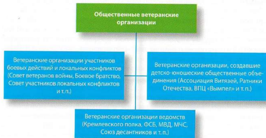
Рисунок 8. Общественные ветеранские организации.

Одним из самых ярких примеров таких детских центров является Военно-патриотический центр «Вымпел», который был создан ветеранами Группы специального назначения органов государственной безопасности «Вымпел» и ветеранами Кремлёвского полка. Многообразием задач по комплексному развитию личности продиктована специфика кадрового состава ВПЦ «Вымпел», в который входят ветераны и действующие сотрудники силовых структур России, а также педагоги, психологи, экологи, врачи, специалисты в сфере культурно-просветительской деятельности. Активное участие в работе ВПЦ «Вымпел» принимают ветераны военных действий, Герои Советского Союза и Герои России.